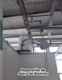
Reparación de Sierra de Bovinos