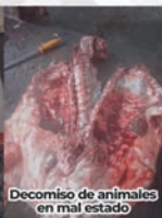
Decomiso de animales en mal estado