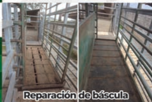
Reparación de báscula

• Octubre • Noviembre • Diciembre • Enero • Febrero • Marzo • Abril • Mayo • Junio • Julio