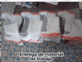
Entrega de material de trabajo