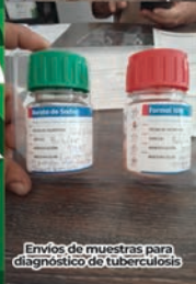
Envíos de muestras para diagnóstico de tuberculosis