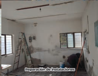
Reparación de instalaciones